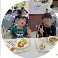
10月15日の通信競技大会に向けて11校合同で宿泊合宿を行いました。